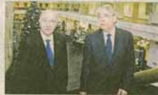
Promotores de Caja España y Caja Duero, tras una reunión informativa.